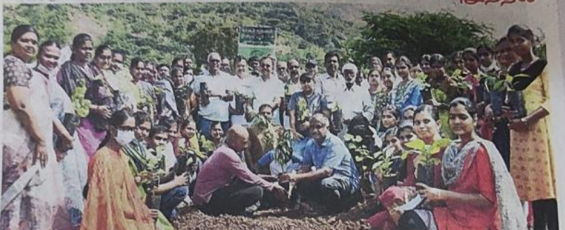
🛮 'வனத்துக்குள் திருப்பூர்' திட்டம் சார்பில், உடுமலை மானுப்பட்டி தம்பிரான் கோவில் அருகே, தனியார் தோட்டத்தில் மரக்கன்றுகள் நடும் பணி நடந்தது.

'வனத்துக்குள் திருப்பூர்' விழாவில் வலியுறுத்தல்